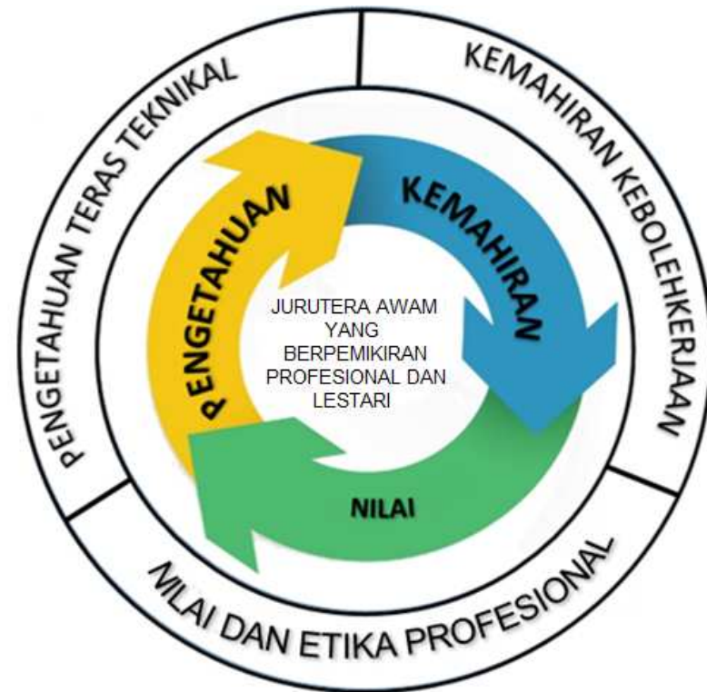
Rajah 2: Kerangka Konsep KSSM PKA

Kerangka konsep KSSM PKA ditunjukkan seperti di dalam Rajah 2.