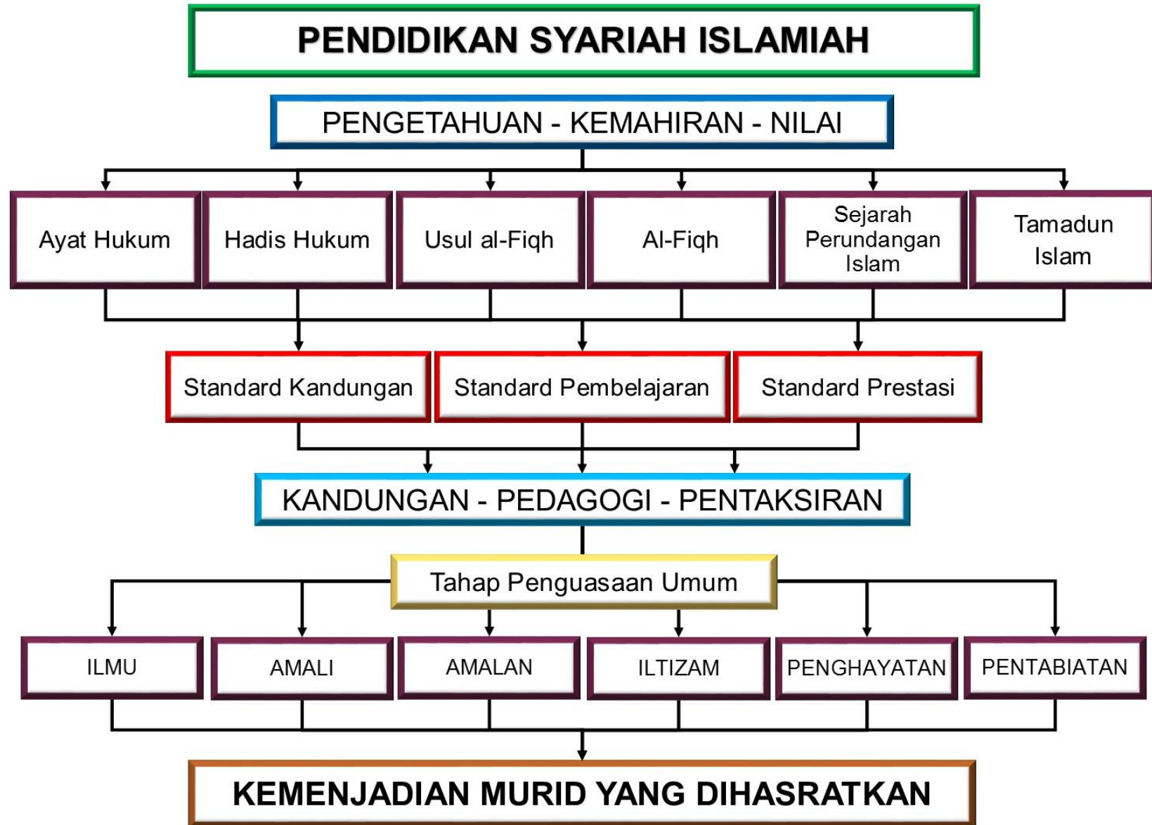
Rajah 3: Organisasi Kandungan Kurikulum Pendidikan Syariah Islamiah