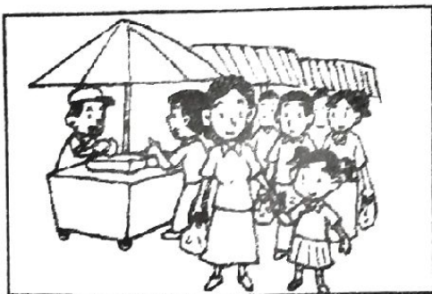
memimpin tangan anak