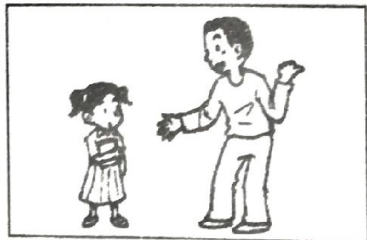
menolak ajakan orang yang tidak dikenali