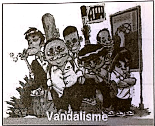
Mengelakkan perbuatan negatif