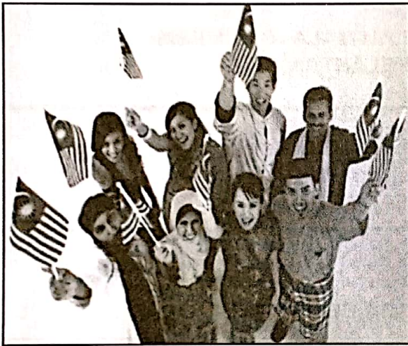
Menjamin perpaduan kaum